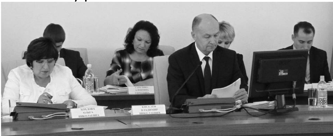
На сентябрьском заседании Законодательного Собрания депутаты внесли корректировки в текущий бюджет. Доходная и расходная части увеличились почти на 850 миллионов рублей за счет поступлений федеральных средств. За их счет депутаты увеличили расходы на обеспечение лекарствами льготников, уличное освещение и образование.